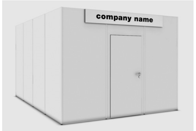
Abb. 2 *Später eingehende Aufträge werden je nach Verfügbarkeit ausgeführt.