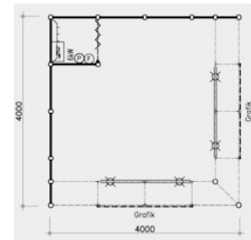
Musterstand 16m 2